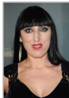
Rosy de Palma